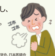
参考：日本呼吸器学会、日本医師会

これらはCOPDの症状です。ありふれた症状のため、見過ごしてしまいがちですが、国内全体では死亡原因の10位、男性では8位を占めており、今後も増えていくことが予想されます。COPDは、肺への空気の流れが悪くなる病気で、進行すると少し動いただけでも息切れし、日常生活に影響が出ます。さらに進行すると呼吸不全や心不全を起こし命に関わります。最大の原因は喫煙であり、喫煙者の15～20%がCOPDを発症します。症状が出る前の早期の発見、治療が大切です。